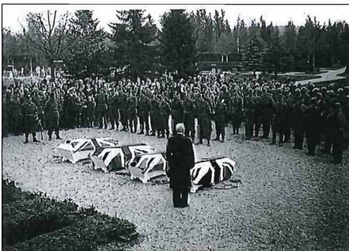
Begravning av de förolyckade den 16 Maj, 1945.

Kvar i Värmland finns den tall som flygplanet stötte emot i samband med nödlandningen. I övrigt finns inget som påminner om denna händelse som så påtagligt utgör en slutpunkt för andra världskriget.